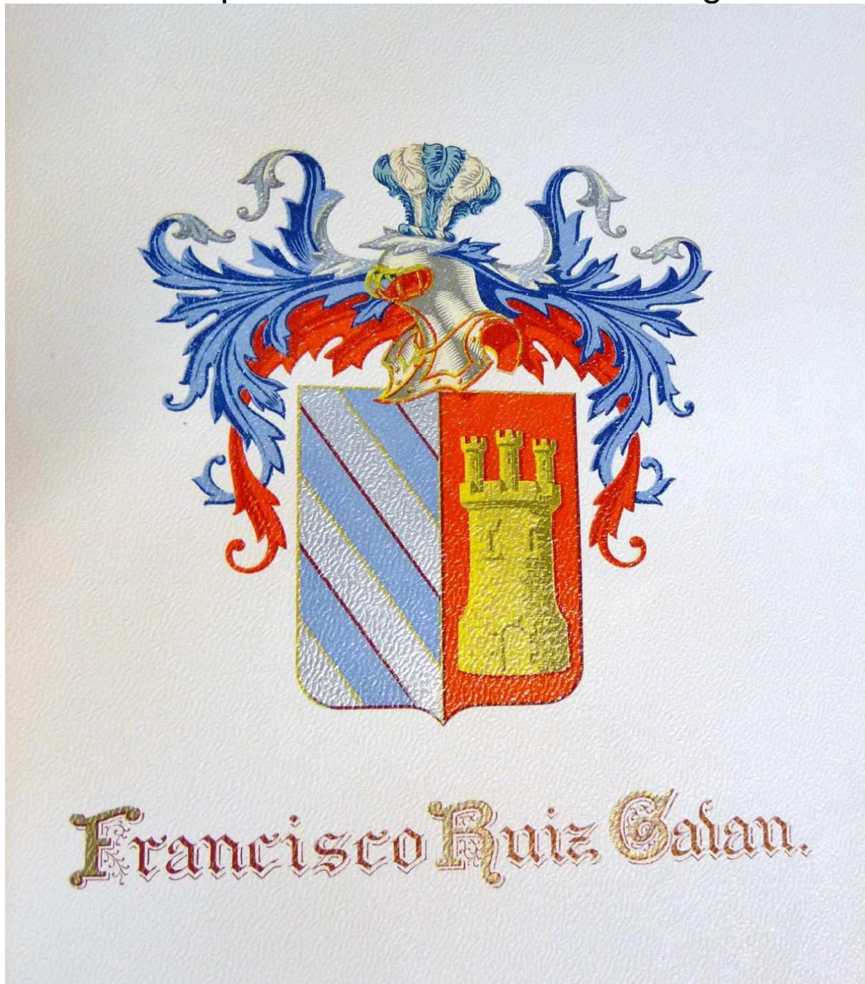
Blason de Francisco Ruiz Galán. Tiré de Documentos relativos a la expedición de Don Pedro de Mendoza y Acontecimientos ocurridos en Buenos Aires desde 1536 a 1541 , Buenos Aires, Imprenta Angel Curtolo, 1936, 315 p.

También estaba allí el depuesto capitán Ruiz Galán. La expresión de su rostro sin energía