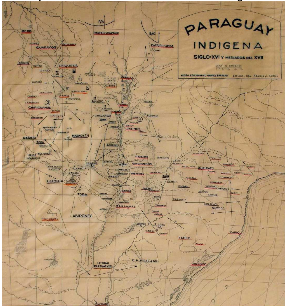
Carte des communautés indigènes habitant la région du Paraguay au XVI e siècle. Photo prise au Musée ethnographique Andrés Barbero à Asuncion. Carte réalisée par Branislava Susnik.